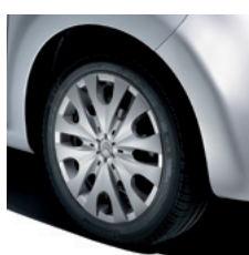
14" stalen 155/65