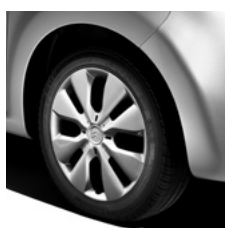
14" stalen 155/65